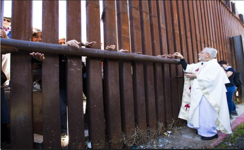
Obispo Gerald Kicanas, diócesis de Tucson, ofrece la comunión a través de la cerca fronteriza a las personas en México durante la Misa en la frontera de Arizona en 01 de abril de 2014

Mito: La mayoría de los inmigrantes cruzan la frontera ilegalmente.