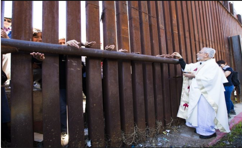
Obispo Gerald Kicanas, diócesis de Tucson, ofrece la comunión a través de la cerca fronteriza a las personas en México durante la Misa en la frontera de Arizona en 01 de abril de 2014

Mito: La mayoría de los inmigrantes cruzan la frontera ilegalmente.